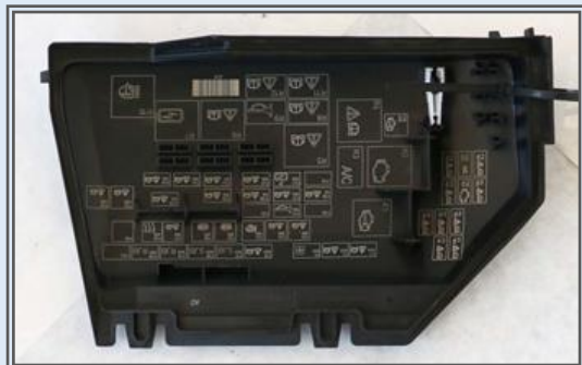
Obr. č. 6