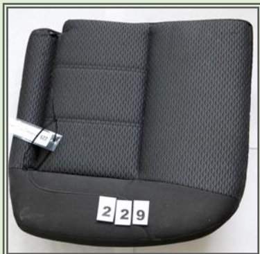
Obr. č. 4a