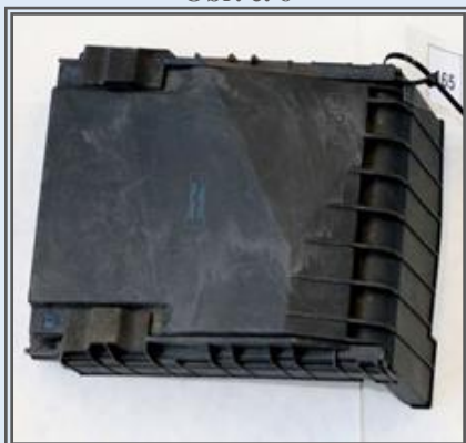
Obr. č. 6