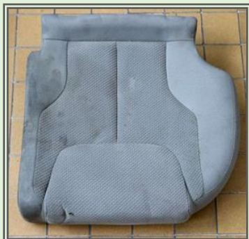
Obr. č. 4a