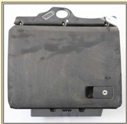
Obr. č. 5