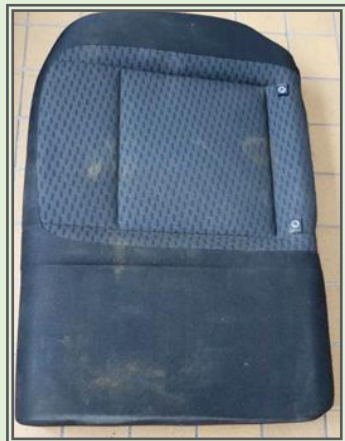
Obr. č. 4a